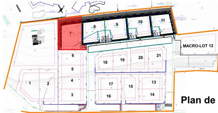
Plan de repérage

Surface de lot: 571 m 2 - Surface de plancher maxi.: 200 m 2