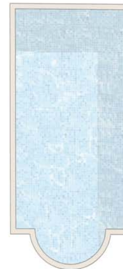
Plan de l'étage