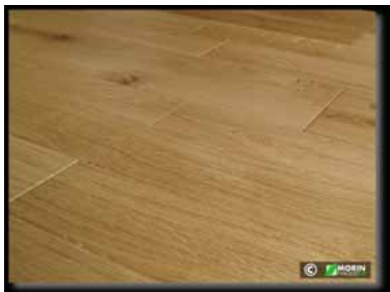
Parquet Chêne Massif type 'TRADIAME' lame de 70 mm de large