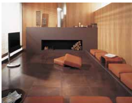
Exemple de pose