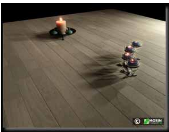
Parquet Contre collé en chêne Mixte entre lames de 70 mm de large et lames de 110 mm

(existe en plusieurs couleurs et nuances)